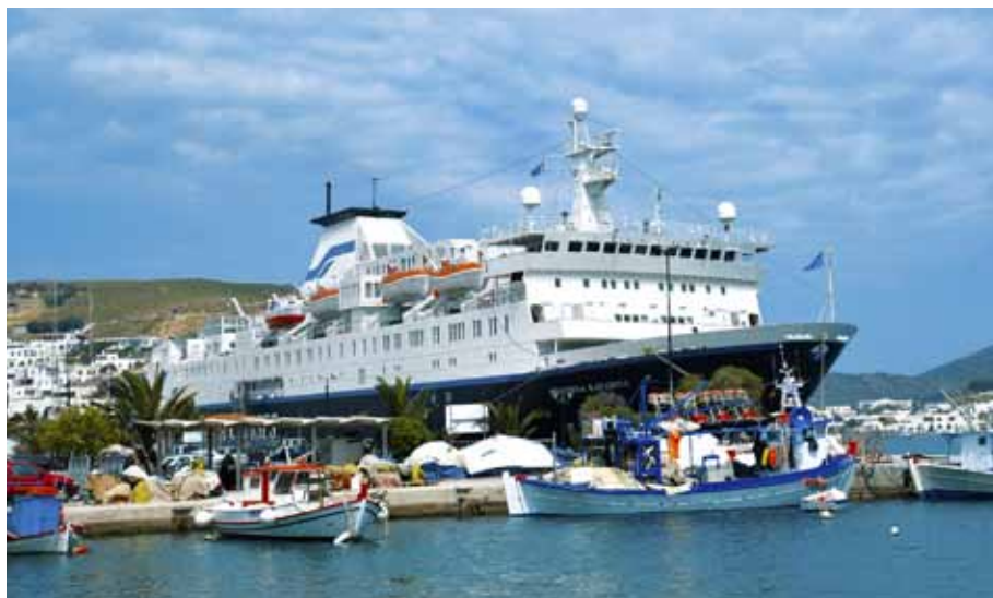
M/S Kristina Katarina